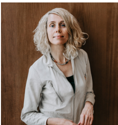
Uta Plate Vita Siehe Seite 2